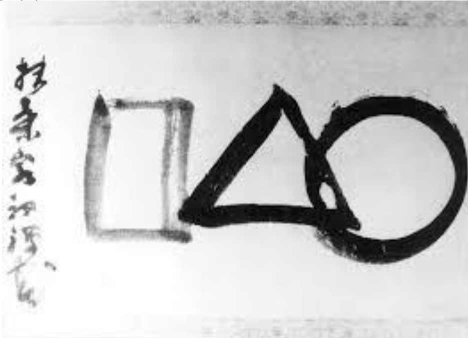
Afb. 2 Gibon Sengai, Symbol of the universe (ca. 1800) ink 51 x 109 cm Idemitsu Museum of Arts, Tokyo

(Hoewel Sengai zelf dit werk geen titel heeft gegeven wordt het meestal onder deze titel aangehaald, bijvoorbeeld door Helen Westgeest. In de catalogus 'Sengai: travelling exhibition of Sengai in Europe' uit 1961 wordt het simpelweg als 'The Universe' aangeduid.)