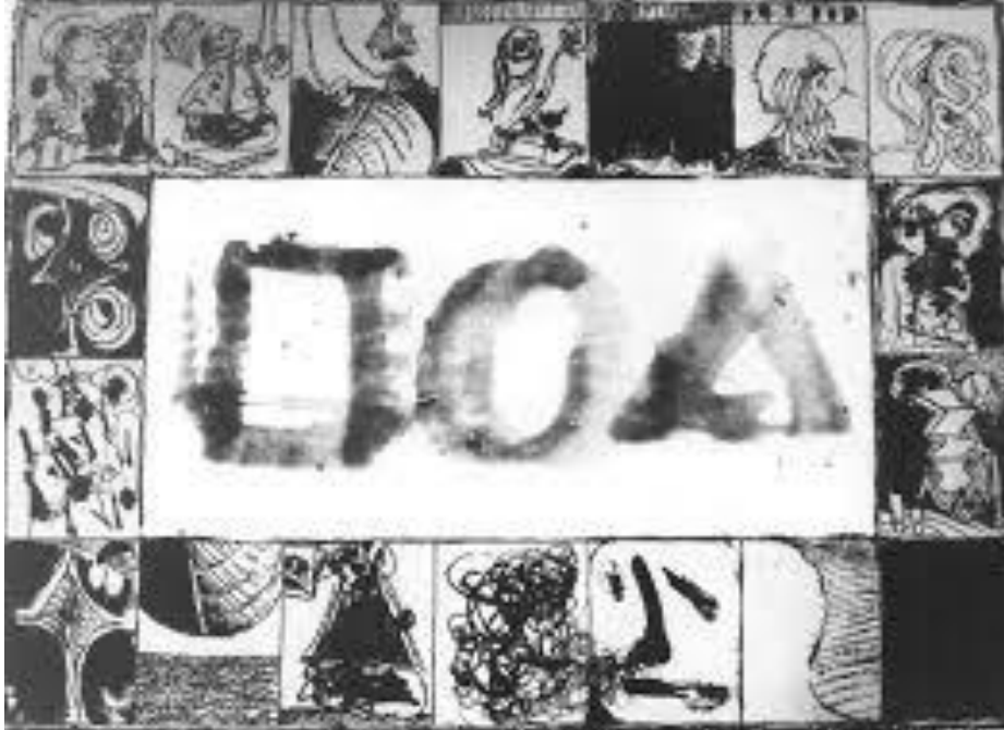
Afb. 1 Pierre Alechinsky, Variations of Sengai's Symbols of the universe, 1960, Lithography and ink on paper, 55 x 76 cm.

De in beide werken gebruikte abstracte symboliek van vierkant driehoek en cirkel, die hemel, mens en aarde symboliseren is eigenlijk atypisch voor het werk van zowel Pierre Alechinsky als Sengai. Maar het laat in de meest letterlijke zin de invloed van de kalligrafie laat zien op het werk van Pierre Alechinsky. Pierre Alechinsky heeft honderden werken op papier gemaakt die geïnspireerd zijn door de Japanse kalligrafie. Enkele daarvan heb ik gezien in het Stedelijk Museum in Amsterdam, Cobra museum in Amstelveen en het museum voor Schone kunsten in Brussel.